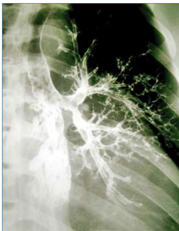
Broncografia sistema bronchiale sinistro: quadro di bronchite cronica bronchiectasica in fumatore

ricordare che nell'epitelio bronchiale dei fumatori l'incremento delle cellule caliciformi mucipare si associa ad un aumento del numero di granulociti neutrofili; dal momento che l'elastasi neutrofila può svolgere una potente azione secretagoga, è ipotizzabile che la presenza dei neutrofili nell'epitelio sia rilevante ai fini dell'attivazione della funzione secretoria delle cellule caliciformi mucipare (4).